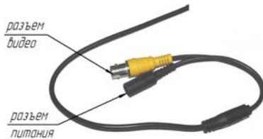
Схема внешних подключений