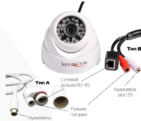
Раскладка RCA разъёма для типа А

*Наличие аудиовхода см. в технических характеристиках.